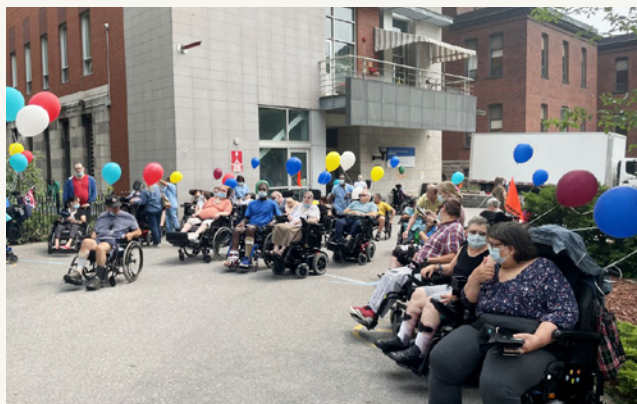
Les résidents du CHSLD Paul-Émile-Léger accueillant le nouvel autobus payé par la Fondation qui leur permettra de faire des sorties à l'extérieur de Montréal.