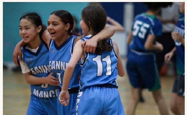
Les joueuses de l'équipe des Dragons dans le cadre du programme en CLSC Rebondir au Féminin financé par la Fondation.