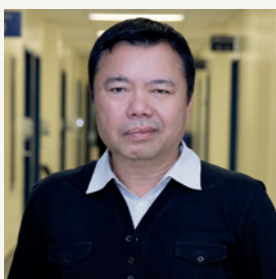
Visal Uon Pharmacie, CIUSSS Centre-Sud