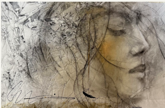
Des fleurs dans ma tête Techniques mixtes sur toile 26 x 39 po